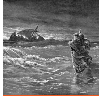
Jesus Walking on the Sea Artist: Gustave Doré Medium: Woodcut print